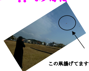
この凧揚げてます!