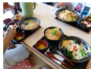
昼食は、うどん屋さん