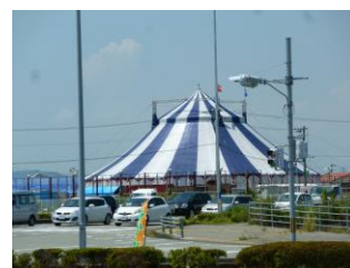
↑ サーカスのテント

阿南市羽ノ浦町へ「ハッピードリームサーカス」を 見に行ってきました。テントの中は暑かったですが、 ピエロのユーモラスな演技に 大笑いしたり、空中ブランコや 大車輪では命綱無し の 危ない演技を 手に汗握りながら見たりして 楽しい時間を過ごしました。