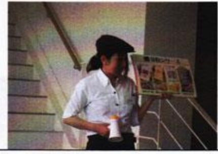
社員さんがわかりやすくガイド ♪