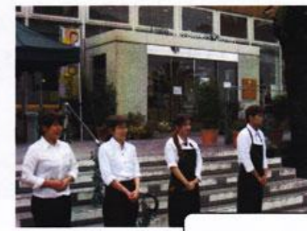
色々、お世話になりました〜♪

6月5日(木)に板野郡松茂町の「ハレルヤ スイーツキッチン」へ行ってきました。徳島県のお土産として大変有名ですね。しかし、なんとチョコレート和菓子としては、日本初のお菓子で、当時の「ハレルヤ」はパン屋さんだったとか！奇想天外なアイデア溢れる当時の日本の風土に想いを馳せながら、ケーキを皆さんの頬張りました！！(村山)