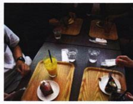
お目当てのケーキ♥ いただきます

6月5日(木)に板野郡松茂町の「ハレルヤ スイーツキッチン」へ行ってきました。徳島県のお土産として大変有名ですね。しかし、なんとチョコレート和菓子としては、日本初のお菓子で、当時の「ハレルヤ」はパン屋さんだったとか！奇想天外なアイデア溢れる当時の日本の風土に想いを馳せながら、ケーキを皆さんの頬張りました！！(村山)