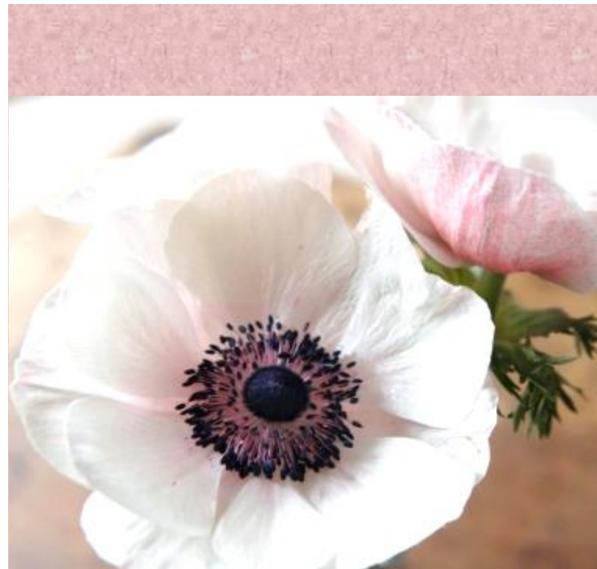
白アネモネ 花言葉は真実、期待、希望